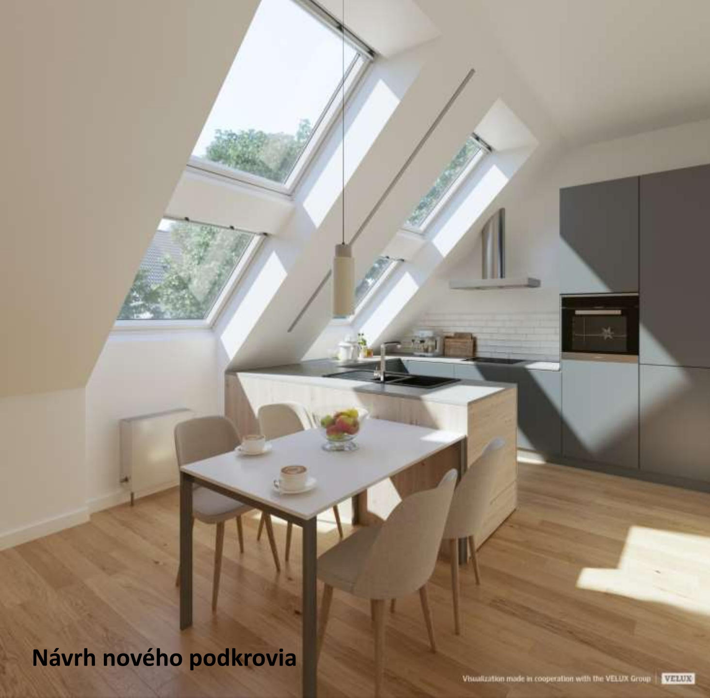
Návrh nového podkrovia

Visualization made in cooperation with the VELUX Group | VELUX